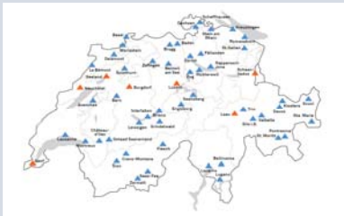
Aqua Allalin Saas-Fee