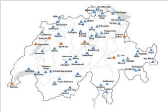
Aqua Allalin Saas-Fee